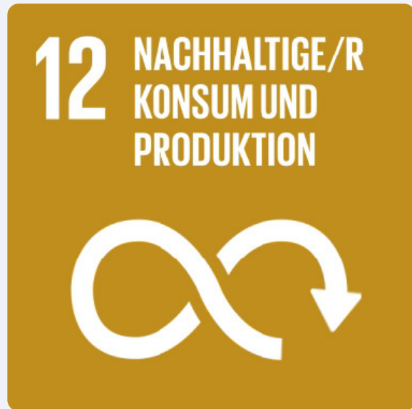
Nachhaltige Nutzung natürlicher Ressourcen und Verringerung des Abfallaufkommens