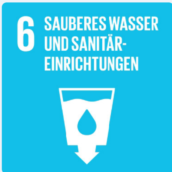
Verringerung der Verschmutzung und Behandlung des Abwassers