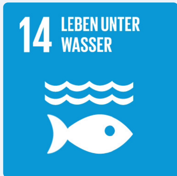
Verringerung aller Arten der Meeresverschmutzung (insbesondere durch vom Land ausgehende Tätigkeiten)

Im SDG-Portal könnt ihr nachschauen, wie Forchheim beim den Themen Abwasseraufbereitung und Trinkwasserverbrauch aufgestellt ist.