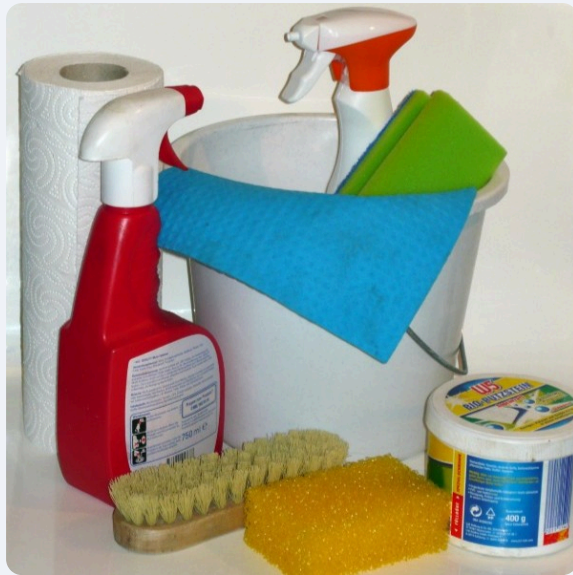
Tipps zur Auswahl von Putzmitteln

Durch die Auswahl der Putzmittel sowie einen sparsamen Umgang mit Putzmitteln und Wasser, können wir beim Putzen die folgenden SDGs direkt beeinflussen. Klickt auf die einzelnen Kacheln, um mehr darüber zu erfahren.