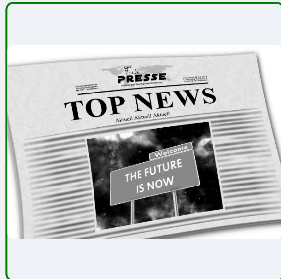
Berichte über unsere Aktivitäten